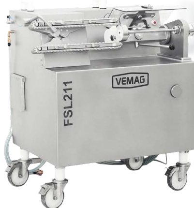
Гибкая сосисочная линия с FSL211

Сосисочная линия FSL 211 – универсальная линия, позволяющая организовать процесс производства сосисок на качественно новом уровне. Ее основные преимущества – универсальность и высокая гибкость в применении. Способность гибко подстраиваться под задачу делает ее незаменимым помощником для средних и небольших производств с широким ассортиментом при сравнительно небольших объемах выпуска каждого вида продукции. FSL211 реализует Ваши идеи.