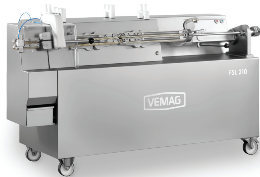
Гибкая сосисочная линия FSL210

FSL210 – название говорит само за себя: гибкая сосисочная линия. Универсальная машина для производства сосисок, подходит практически для любого применения. На самом деле, гибкость – это слово, которое лучше всего описывает FSL210. Она идеально подходит для выпуска широкого ассортимента различных продуктов. Машина всегда гибко адаптируется под продукт, а не наоборот. FSL210 воплощает все идеи в реальность.